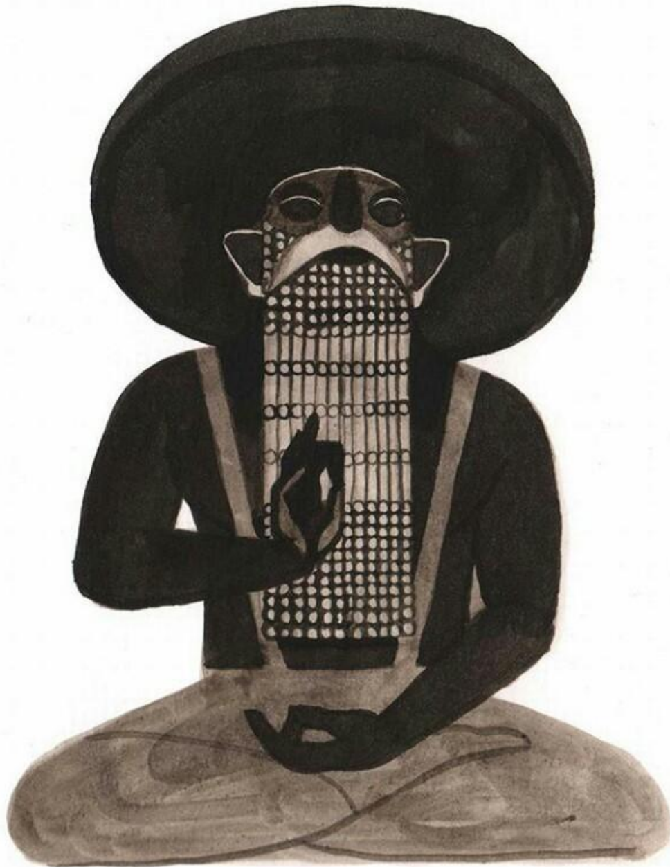
Dessin, Evens Brecht.